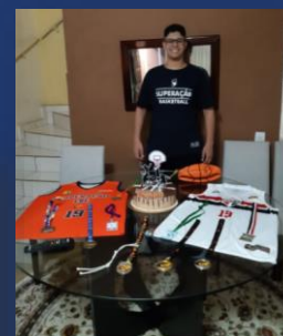
CURSOS & EDUCAÇÃO